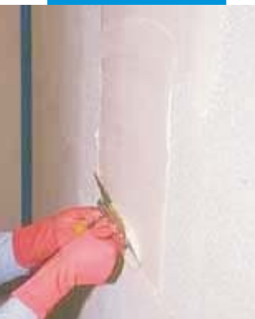
nanášení lepicího tmelu na podklad z Mapegumu WPS