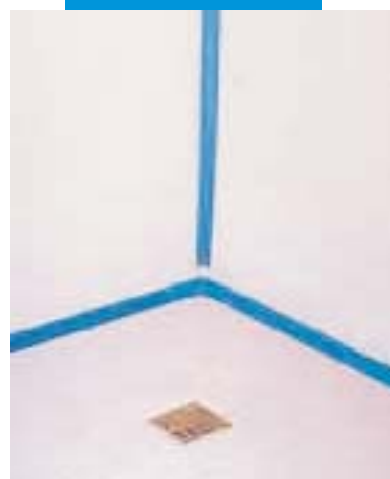
dokončená hydroizolace sprchového koutu