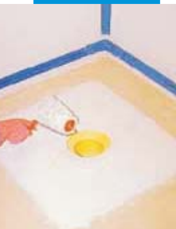
nanášení Mapegumu WPS v prostoru podlahové vpusti sprchového koutu