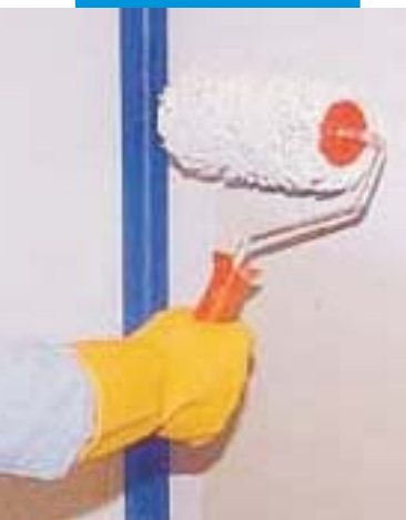
nanášení Mapegumu WPS na stěny válečkem

Mapegum WPS není nebezpečná látka ve smyslu platných norem na zatřídění přípravků. Doporučuje se dodržovat obvyklá opatření, platná při manipulaci s chemickými výrobky. Bezpečnostní list je na vyžádání profesionálních zpracovatelů k dispozici.