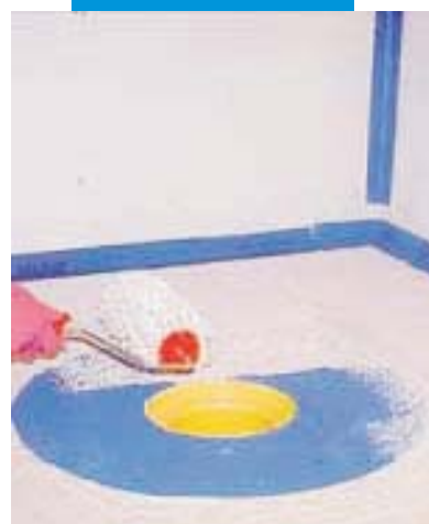
překrytí speciální manžety Mapeband vrstvou Mapegumu WPS