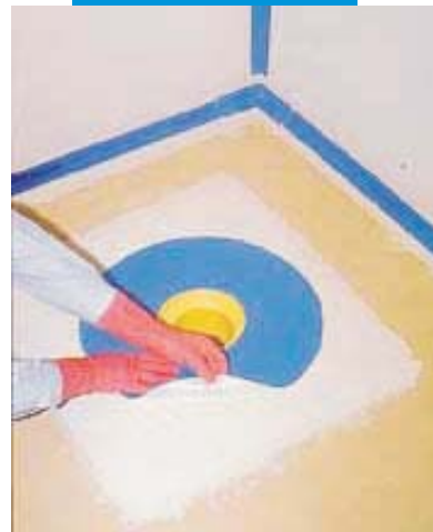
osazení speciální manžety Mapeband do Mapegumu WPS