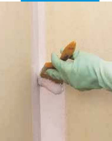
nanášení Mapegumu WPS štětcem