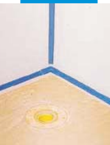
hydroizolace stěn ve sprchovém koutu s použitím Mapegumu WPS a Mapebandu