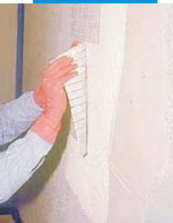
montáž skleněné mozaiky