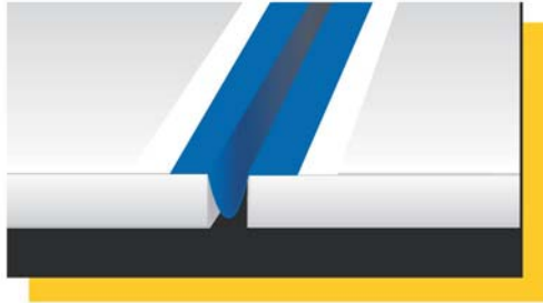
Řešení utěsnění dilatační spáry (např. balkon nebo terasa).