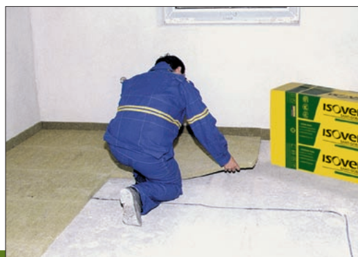
Ukázka aplikace výrobku Isover N

4) Stanoveno výpočtem pro těžkou plovoucí podlahu na standardní 120 mm ŽB stropní desce a 50 mm rozněsací bet. desku.